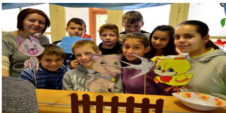
Foto : Žiaci 6. ročníka