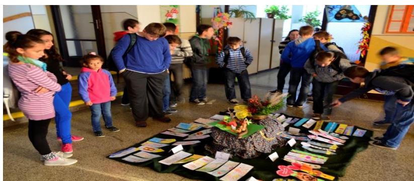
Foto . Žiaci pri obdivovaní vystavených záložiek

Už teraz sa tešíme na ďalší ročník. Takýmto spôsobom sa nám podarilo prebudiť u žiakov záujem o čítanie.