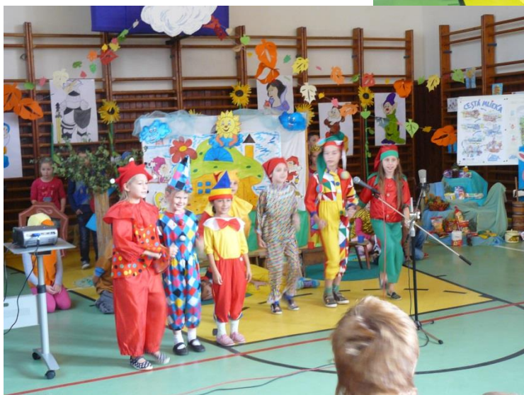
Foto: Priebeh rozprávky