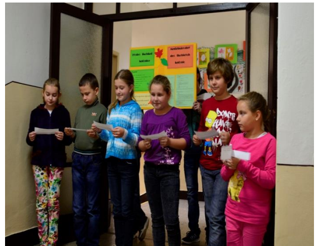
Foto : Žiaci 5. ročníka informujú o Týždni knižnic

Na naše podujatie sme pozvali pracovníkov lesnej pedagogiky, ktorí sú zamestnancami štátneho podniku Lesy Slovenskej republiky Odštepny závod Sobrance. Celé podujatie sa začalo na cestičke cez rozprávkový les. Žiaci boli oblečení v kostýmoch rozprávkových bytostí. Predstavovali hrdinov z rozprávok o lese. Lesní pedagógovia mali pre žiakov pripravené jednotlivé stanovišťa. Na týchto stanovištiach plnili úlohy, ktoré vyhodnocovali lesní pedagógovia.