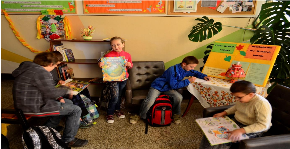
Foto : Mini knižnica vo vestibule školy