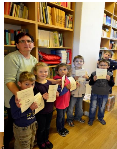
Foto : Zápis a prehliadka prvákov v knižnici