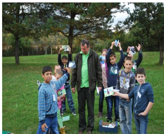
Foto : Vypracované pracovné listy