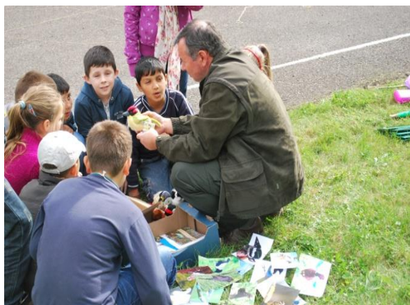
Foto : Spoznávanie vtákov

Na stanovišti pri Lesnej žienke žiaci mali uhádnuť, ako sa ktorý vtáčik volá a aký spev vydáva. Všetko si zaznamenali do pracovných listov.