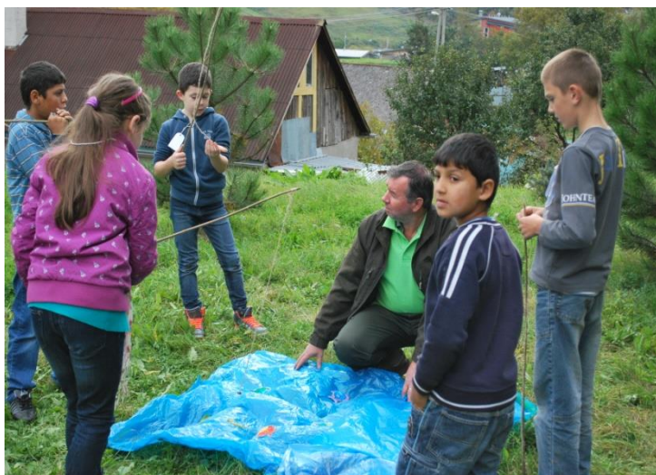
Foto : Lov rýb v rybníku