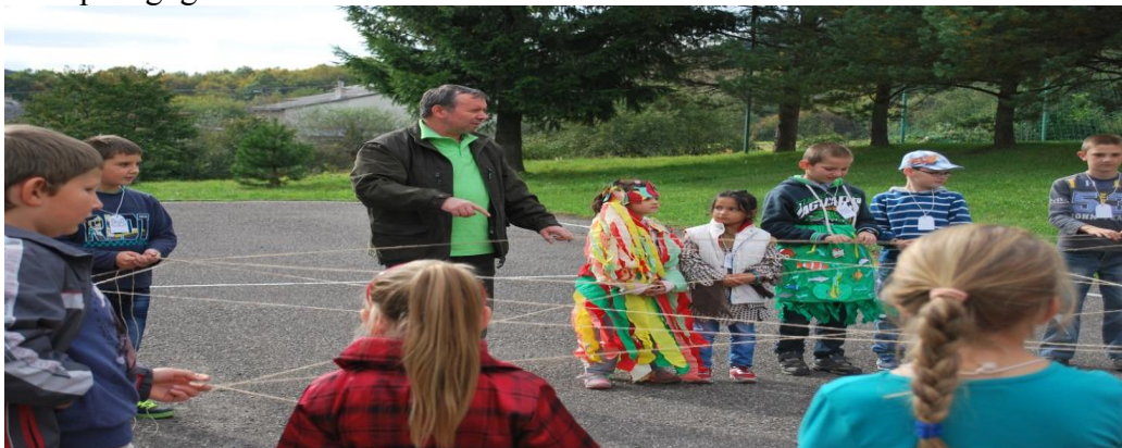
Foto : Tvorba pavučiny

Na naše podujatie sme pozvali pracovníkov lesnej pedagogiky, ktorí sú zamestnancami štátneho podniku Lesy Slovenskej republiky Odštepny závod Sobrance. Celé podujatie sa začalo na cestičke cez rozprávkový les. Žiaci boli oblečení v kostýmoch rozprávkových bytostí. Predstavovali hrdinov z rozprávok o lese. Lesní pedagógovia mali pre žiakov pripravené jednotlivé stanovišťa. Na týchto stanovištiach plnili úlohy, ktoré vyhodnocovali lesní pedagógovia.