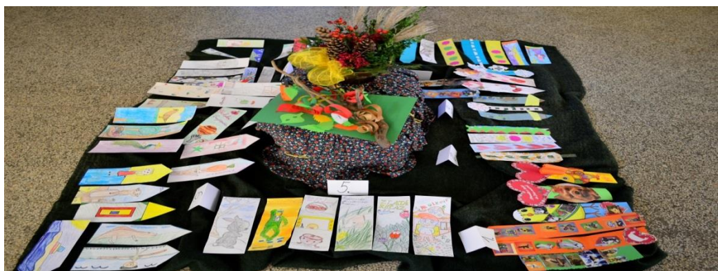
Foto : Výstavka záložiek do knihy vo vestibule školy