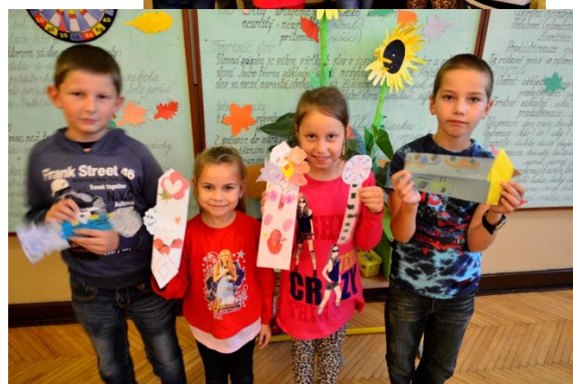
Foto : Žiaci a ich záložky