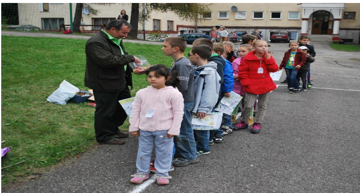
Foto : Vyhodnotenie aktivít

Rýchlo sa dokončila práca a začína sa príprava na odohranie divadielka, lebo sa začali schádzať rodičia na vystúpenie.